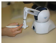
FIGURE 1 : PHANToM Omni

Cette étude s'intègre dans le projet européen MICOLE [1] dont le but est de créer un environnement d'apprentissage collaboratif et multimodal pour enfants déficients visuels. Dans le cadre de ce projet, nous avons créé un prototype d'application d'exploration de circuits électriques utilisant le retour de force. Le parcours se fait à l'aide d'un PHANToM (figure 1)