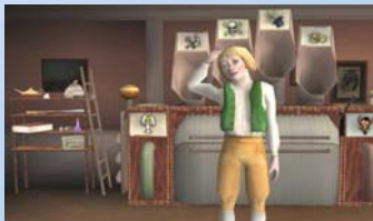
NICE Project (Projet européen)