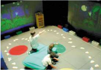
Collaboration entre enfants et adultes

▪Différentes formes : Ludique, Ludoéducative, pour l'apprentissage, pour la gestion des connaissances, virtuelle