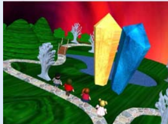
Environnement Virtuel pour le storytelling collaboratif